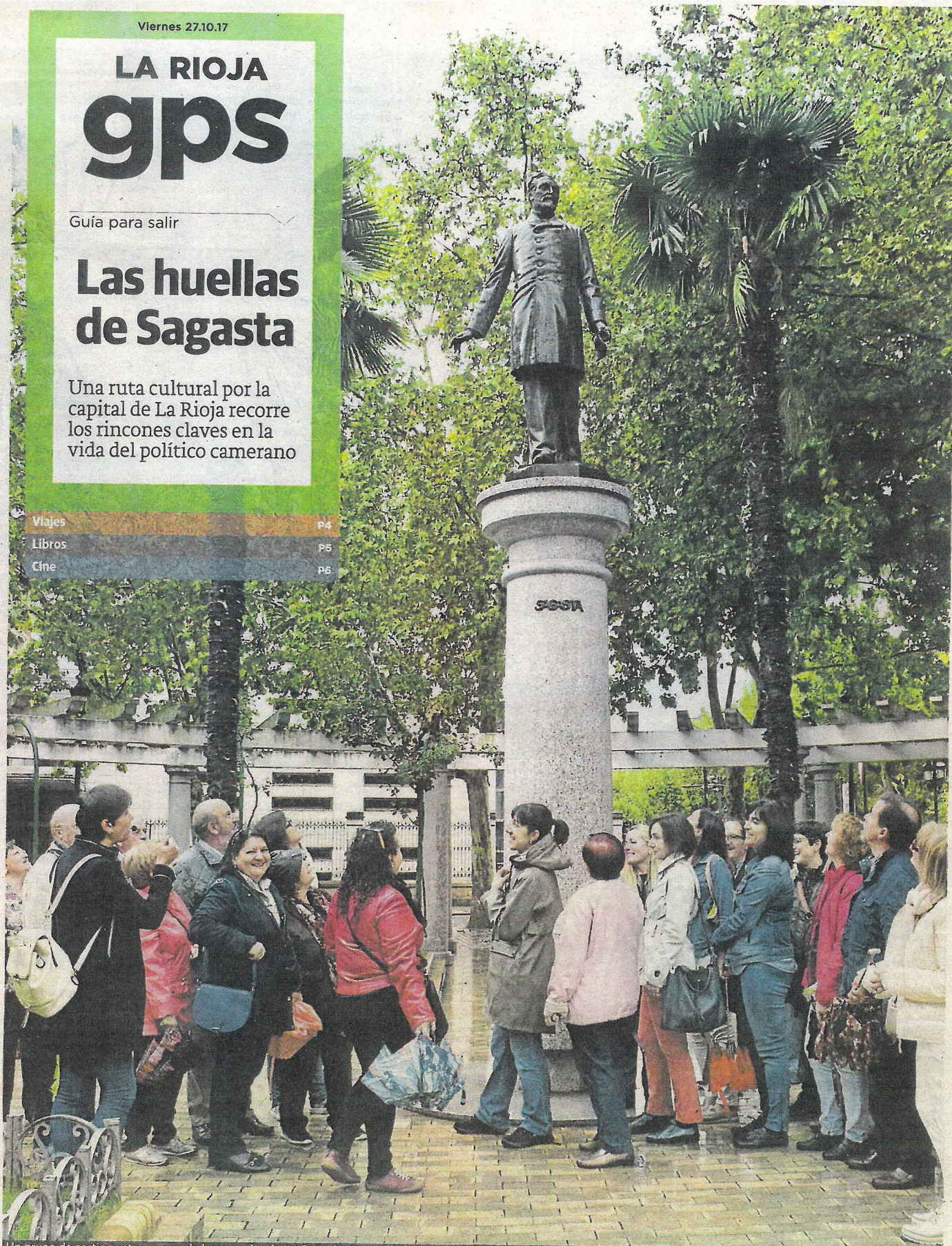
Un grupo de participantes en una de las jornadas de 'La Ruta de Sagasta en Logroño' contemplan la estatua del prócer torrecillano que se erige en La Glorieta.