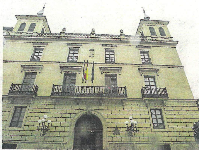
Palacio de los Chapiteles. Sede del IER y de la Fundación Sagasta. :: JUSTO RODRÍGUEZ